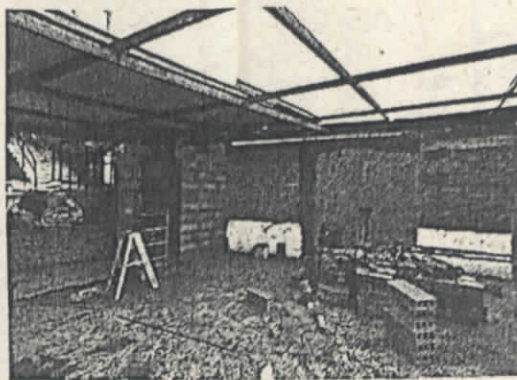
Imagen 2. Construcción actual.