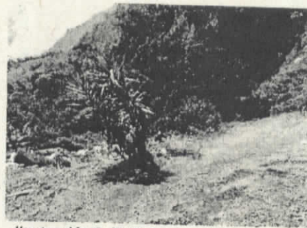
Ilustración 2. Vista hacia el SW

En la visita prospectiva se evidenció un acopio no técnico de suelo, escombros y basuras, el cual representa una amenaza de deslizamiento y, debido a la cercanía de la ladera sobre la que está depósito antrópico (botadero) con una fuente hídrica ubicada en cotas inferiores, en caso de la manifestación de un deslizamiento en épocas de alta pluviosidad, podría desencadenarse un taponamiento y represamiento de la quebrada, propiciando la ocurrencia de una creciente súbita o avenida aluviotorrenciales.